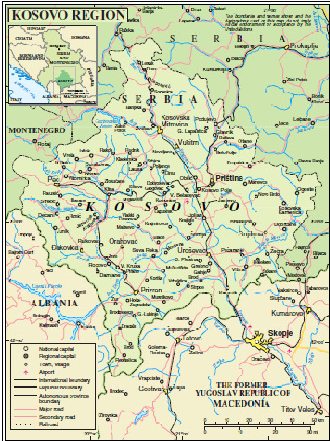
Map No. 4998 Rev. 3 UNITED NATIONS March 2007